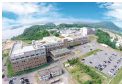
1. 鳥取医療センター

国立病院機構は全国に140病院のネットワークを持っています。中国四国グループは、中国・四国地方9県に22病院があり、それぞれの地域で医療を提供しています。