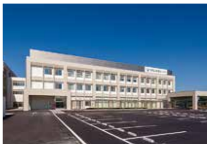
6. 南岡山医療センター

岡山県岡山市北区田益1711-1 https://okayama.hosp.go.jp/