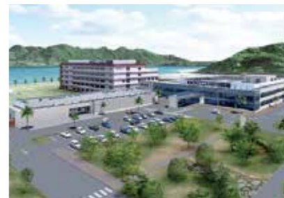
15. 柳井医療センター

山口県岩国市愛宕町1丁目1番1号 https://iwakuni.hosp.go.jp/