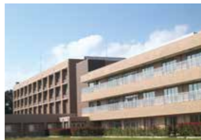
16. とくしま医療センター東病院

徳島県板野郡板野町大寺字大向北1-1 https://higashitokushima.hosp.go.jp/