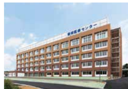
21. 愛媛医療センター

愛媛県松山市南梅本町甲160 https://shikoku-cc.hosp.go.jp/hospital/