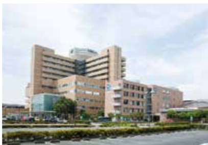
5. 岡山医療センター

島根県浜田市浅井町777-12 https://hamada.hosp.go.jp/