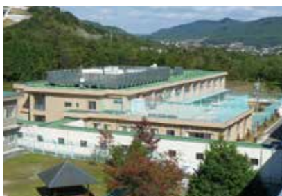
11. 賀茂精神医療センター

広島県東広島市西条町寺家513 https://higashihiroshima.hosp.go.jp/