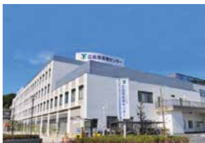
9. 広島西医療センター

広島県福山市沖野上町4-14-17 https://fukuyama.hosp.go.jp/