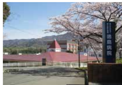
17. とくしま医療センター西病院

徳島県板野郡板野町大寺字大向北1-1 https://higashitokushima.hosp.go.jp/