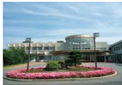
13. 山口宇部医療センター

山口県下関市長府外浦町1-1 https://kanmon.hosp.go.jp/