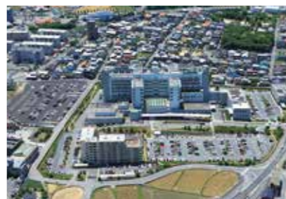
20. 四国がんセンター

香川県善通寺市仙遊町2-1-1 https://shikoku-mc.hosp.go.jp/