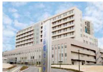
14. 岩国医療センター

山口県宇部市大字東岐波685 https://yamaguchiube.hosp.go.jp/