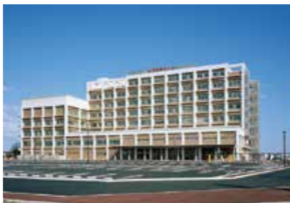
2. 米子医療センター

鳥取県米子市車尾4丁目17-1 https://yonago-mc.hosp.go.jp/