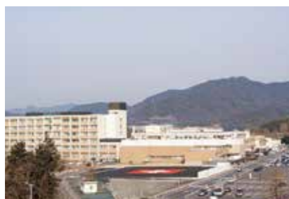
10. 東広島医療センター

広島県大竹市玖波4丁目1-1 https://hiroshimanishi.hosp.go.jp/