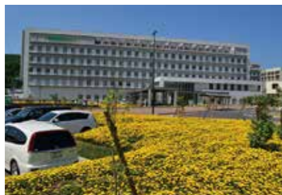
4. 浜田医療センター

島根県松江市上乃木5丁目8-31 https://matsue.hosp.go.jp/