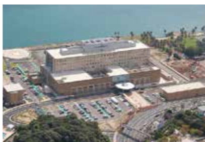
12. 関門医療センター

山口県下関市長府外浦町1-1 https://kanmon.hosp.go.jp/