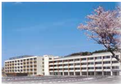
3. 松江医療センター

鳥取県米子市車尾4丁目17-1 https://yonago-mc.hosp.go.jp/