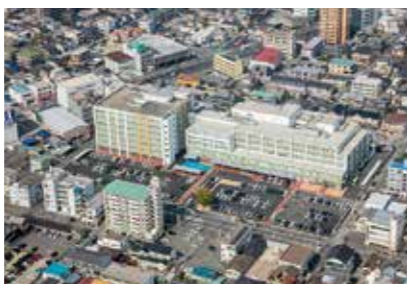
8. 福山医療センター

広島県福山市沖野上町4-14-17 https://fukuyama.hosp.go.jp/