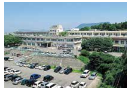
18. 高松医療センター

徳島県吉野川市鴨島町敷地1354 https://tokushima.hosp.go.jp/