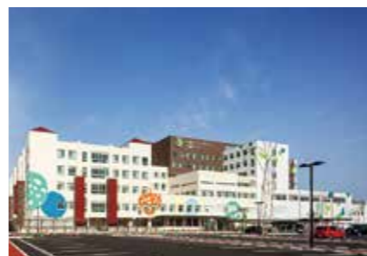
19. 四国こどもとおとなの医療センター

香川県高松市新田町乙8 https://takamatsu.hosp.go.jp/